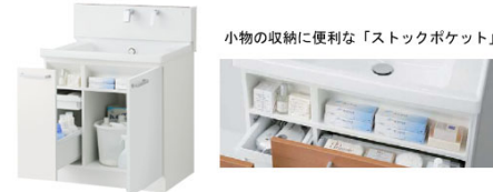
片引き出しタイプ(間口750mm)