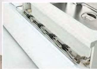
シンク前包丁差し