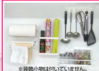
※装飾小物は付いていません。