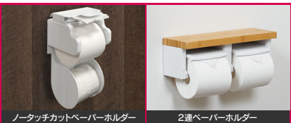
ノータッチカットペーパーホルダー