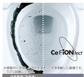
従来陶器(洗浄後) セフィオンテクト(洗浄後)

渦を巻くように少ない水で効率的に洗浄。汚れやすい便器後方に勢よく水が当たり、汚れをしっかりと洗い流します。