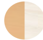
天板 （木目・ホホワイト/リバーシブル）

※製品詳細は弊社ホームページをご覧ください。商品発売に合わせ商品情報掲載いたします。