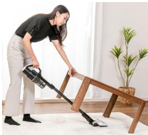
軽量でお掃除も楽々