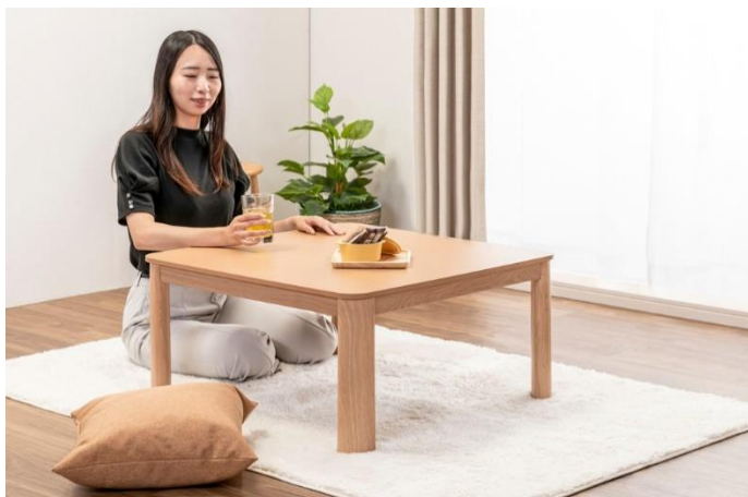
一年中テーブルとしてお使いいただけるデザイン